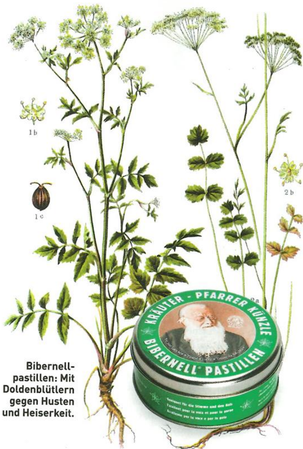
Bibernell-pastillen: Mit Doldenblütlern gegen Husten und Heiserkeit.

Patent verklagt. Mehr als den Naturheiler erzürnte dies aber seine Anhänger. In der Folge kam es 1922 zur Bündner Volksabstimmung «für eine Freigabe der giftfreien Kräuterpraxis», welche mit überwältigendem Stimmenmehr angenommen wurde.